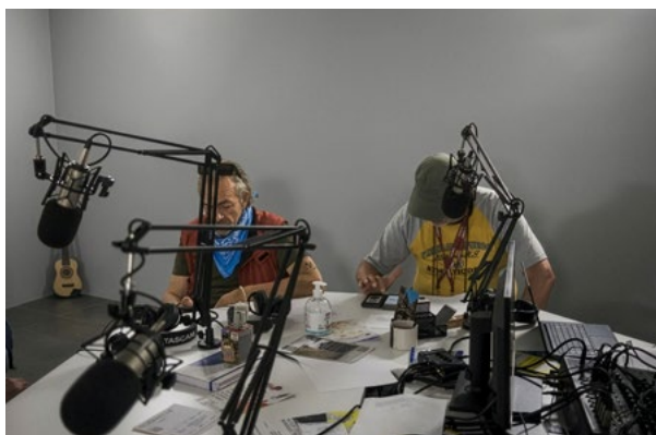
La redazione con ospiti e collaboratori.